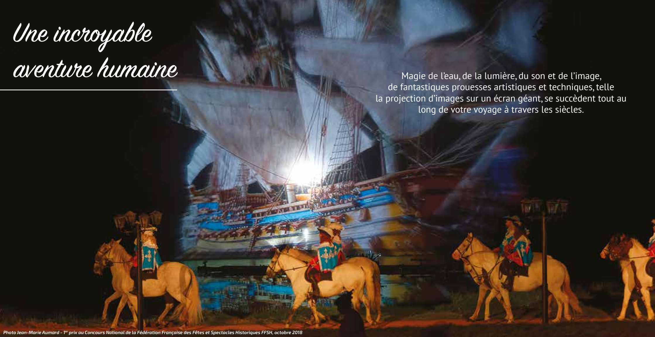
1 er prix au Concours National de la Fédération Française des Fêtes et Spectacles Historiques FFSH, octobre 2018

Magie de l'eau, de la lumière, du son et de l'image, de fantastiques prouesses artistiques et techniques, telle la projection d'images sur un écran géant, se succèdent tout au long de votre voyage à travers les siècles.