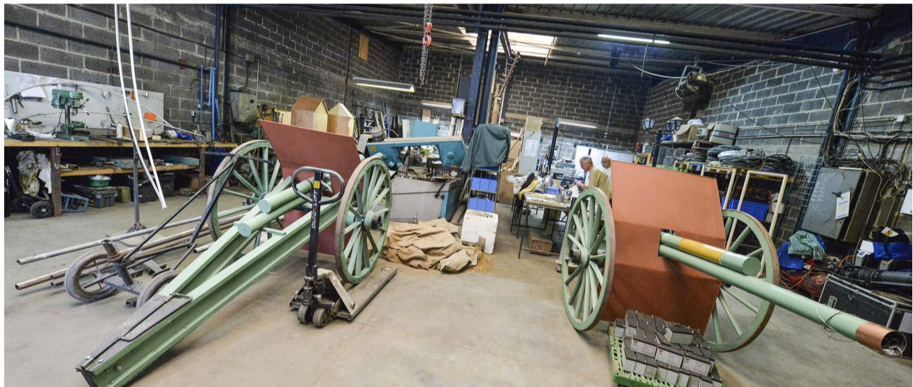
C'est désormais sous l'intitulé « Féeries nocturnes » que la troupe de bénévoles produira ses spectacles. Sur les photos, les différents préparatifs du nouveau spectacle 2018 « Eclats d'histoire ».